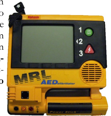
Un desfibrilator semiautomatic

Se lo còr quita de batre, parlam d' arrèst cardiac : es bravament dangerós per çò que los organs morisson bravament lèu se son pas alimentats en dioxigèn. Dins aqueles casses, lo còr comença sovent per se botar en fibrilacion (se contracta un pauc a l'azar). De còps, lo podèm "tornar lançar" en utilizant un desfibrilator , un aparelh que manda un tust (fr : choc) electric important e que pòt tornar sincronizar las contrac- cions cardiacas. De tot biais, cal sonar sulpic lo numèro 15.