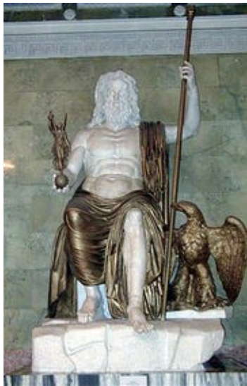
Reconstitution de la statue chrysléphantine de Zeus olympien.

La statue a été réalisée selon la technique chrysléphantine : des feuilles d'or et des plaques d'ivoire recouvrant un bâti en charpente de bois. On distingue à droite de Zeus un aigle qui est l'un de ses attributs. Il tient à la main la déesse de la victoire dont le nom est "Niké".