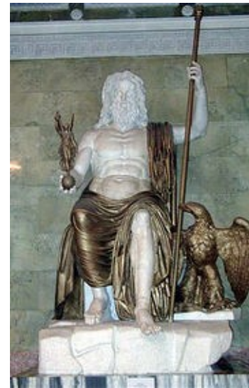
Reconstitution de la statue chrysléphantine de Zeus olympien.

La statue a été réalisée selon la technique chrysléphantine : des feuilles d'or et des plaques d'ivoire recouvrant un bâti en charpente de bois. On distingue à droite de Zeus un aigle qui est l'un de ses attributs. Il tient à la main la déesse de la victoire dont le nom est "Niké".